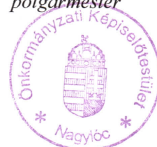
Szalai Gábor polgármester