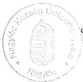
dr. Pintérné Szabó Judit polgármester